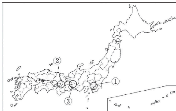
三大都市圏への人口集中

(3) 次の略地図中とグラフ中の①～③にそれぞれ共通してあてはまる都市圏名を答えなさい。 [ 7 ][ 8 ][ 9 ]